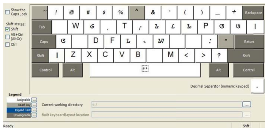
Posisi papan tombol dengan Shift